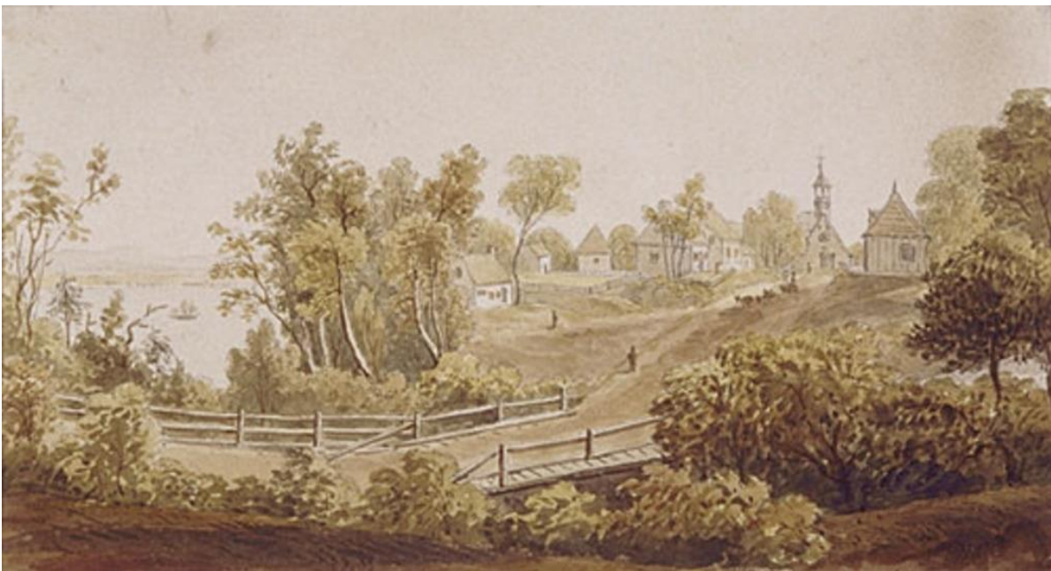
Beaumont 1821. Aquarelle d'auteur inconnu. Musée des Beaux-Arts du Québec.

En 1713, Charles Couillard, fils, héritier principal de la seigneurie de Beaumont, située sur la rive sud du fleuve près de Québec, requérait du Gouvernement de Québec une augmentation de territoire qu'il obtint derrière la seigneurie, vers le sud. Ainsi, cette acquisition était, et est, légale puisqu'accordée par l'Administration coloniale de Québec. Par surcroît, elle aurait très bien pu s'appuyer sur les « Arrêts de Marly » édités à Paris au Conseil d'Etat du Roy en 1711.